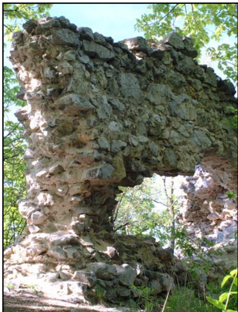
A Dédési vár maradványa, Bükk hegység