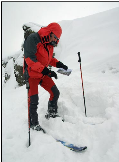
Sítúrán a Madarasi Hargitán