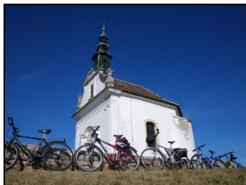
Kálvária templom, Tata