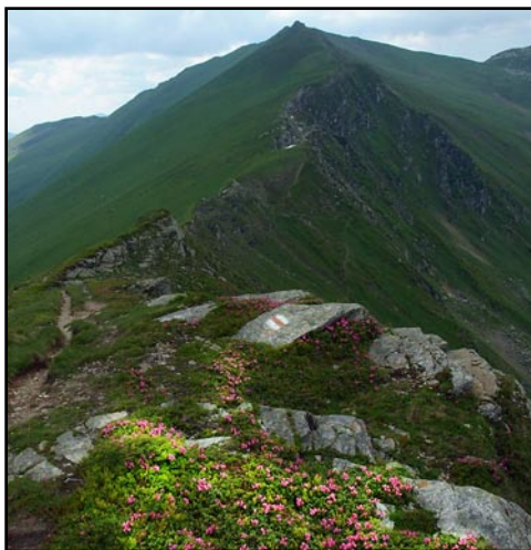
Gerincút, Radnai havasok