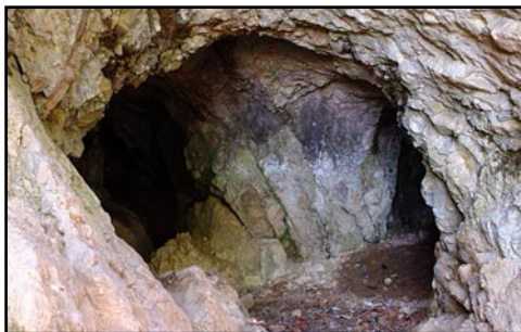
Barlang bejárat, Bükk hegység