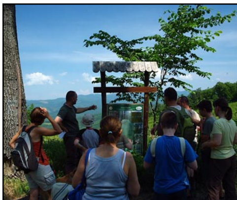
Erdőjárók túrája, Bükk hegység