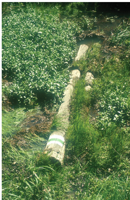
A Sas-patak hídja – útvonal törölve