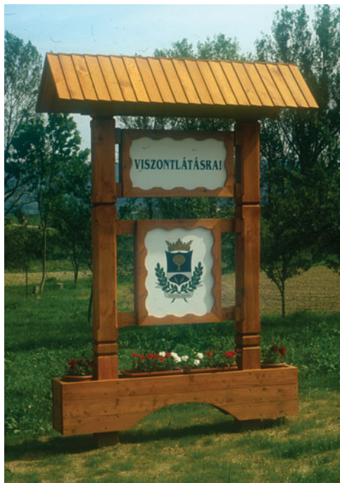
Hídvégárdó. Ide még visszajövünk

Hídvégárdó nincs messze... (tőlem), másrészt e megtisztelő meghívásának nem lehet nemet mondani. Szombaton délelőtt még a Baradla-völgyben „jelzémódosítást” csináltunk, vagyis a régi zöldből új zöld keresztjelzés készítettünk, délután már Ardóban voltunk felöltözve – kinyalva úgy, ahogy jelzésfestőktől telik. Amikor a faluba megérkeztünk, az ünnepség már javában tartott. A Gedeon kúria udvarán felállított színpadon, a térség parlamenti képviselőjétől éppen a polgármester úr vette át a szót. Jókedvűen nyitotta meg az Ardói napokat. Matusz Tamás ahogy a színpadot elhagyta, azonnal odajött hozzánk és személyesen üdvözölt minket is (jelzésfestőket – Mónikát és engem). Jól esett, nagyon megtisztelt. Az ünnepi programok: gyermekszínpad, asszonykórus, beatzene sorra követték egymást a pódiumon. Egyszer még a polgármester is énekelt egy dalos társaságban. Vidáman, könnyedén, ahogy egy fiatal, dinamikus, sikeres polgármesterhez illik. A falunak húsz éve, folyamatosan ő az első embere. Hídvégárdó virágzik. A környékbeli falvak irigylik. Van miért. Hídvégárdó polgármestere minden fórumot végiglátogat személyesen, kitartó makacssággal kéreget, közbenjár, pályázatokat ír. Gyűjti a pénzt, hogy munkát adhasson a munka nélkül maradt falubelieknek. Ezért a környéken Ardóban a legkisebb a munkanélküliség. A szomszéd falvakban a falubeliek állnak sorba kéregetni, egyre növekvő öntudattal az önkormányzatok asztalait ütni-vern, ha éppen a sáros, piszkos udvarokon ücsörgés, unat-