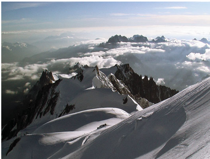
A Mount Blancra felvezető úton

Sokat vártunk az alkalmas időjárásra, hogy elindulhassunk a Mont Blanc csúcsára (4807 m).