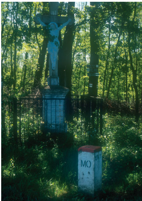
A Galajda kereszt a határsávban

A jelzéseket az eddig megszokott irányunktól eltérően, Balassagyarmat felé kezdtük ontani magunkból. Lehetett volna szigorúan a határkövek mentén próbálkozni, de onnan a fákat kiirtották, ezért a kissé távolodó köves úton potyogtattuk el az ott lévő fákra. Amikor az irtás után az út és a határsáv összetalálkozott, természetesen a tovaftó határsávban vittük tovább a jelzéseket. Perecsé felé eltér az út. Az elágazáshoz eligazító táblát tettünk. Különösebb gond nélkül festhettünk tovább, alkalmas fákra. Feltűnt nekem, hogy a nagy esőzések ellenére, alig vizes a határsávi út, jól járható. Ahogy ezt kimondtam, azonnal ingoványos, lápos részekre értünk. Mindenütt, mindenhol folytak, folydogáltak vizek. Néztük a térképeket, semelyik sem jelzett patakokat. Nyilván az elmúlt napok nagy esőzéseinek nyomai voltak – gondoltuk. Ahogy a Szirákó-völgyet É-ra elhagytuk, egy nagyobbacska patakon, hídon kellett átlépkednünk.