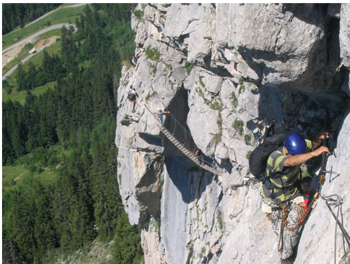
Egy izgalmas részlet a sziklafalon

Az utolsó napra esett a harmadik ferrata, az Ives Pollet-Villard, amely La Clusaz közelében található. A jó idő miatt sokan túráztak rajtunk kívül is, ami kellemetlen torlódásokhoz vezetett. Ez volt a legszebb, egyesek szerint a legnehezebb mászás, sok kitett szakasszal, egy függőhíddal és egy nagy áthajlással, amelyet azonban el lehetett kerülni.