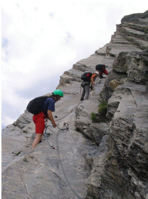
Bemelegítés a csúcsmászáshoz

nél-szebb virágok (kosborok, havasi róza, liliomok, harangvirágok stb.) pompáztak lábaink előtt. A következő napokban azonban az időjárás nem volt kegyes hozzánk, de még az eső sem tántorított el minket a kirándulásoktól.