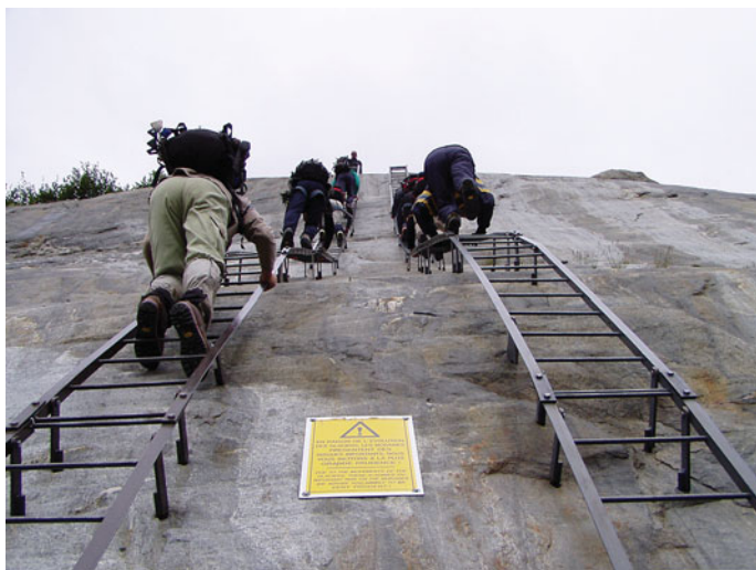
Viharos időben a létrák villámhárítóként viselkednek

leírása megtalálható Pascal Sombardier: Francia Alpok c. könyvében). Ezek egyike volt a Roc du vent (2360 m), melynek különlegessége egy drótkötélhíd. Kb. 60 km buszozás után érkeztünk a Plan de la Lai menedékházhoz (1813 m), a túra kiindulópontjához. A csapat egy része már javában fönt araszolt a sziklafalon, amikor hirtelen kitört a vihar, szél, eső, villámlás. Akik még a fal lábánál várakoztak, visszafordulván egy kis barlangban kerestek menedéket, a többieknek azonban nem volt választásuk, tovább mentek, vállalva a kockázatot.