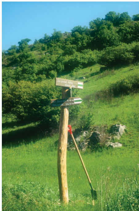
A Sas-patak hídjá jelölés – útvonal törölve