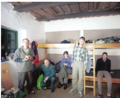
A szobában kettő, a konyhában egy laticel (polifoam) borítású emeletes ágy van. Ágynemű nincs, hálózástakot mindenkinek hoznia kell.

dés után megszaporáztuk lépteinket, így éppen időben odaértünk az ünnepség színhelyére, a Nagy-tó mellett felállított emlékműhöz. (Az itteni eseményekről egy másik írásunkban olvashat a Kedves Érdeklődő.)