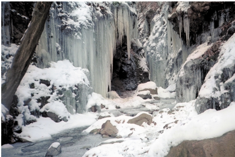
Tarjánka-szurdok részlete a fagyos Mátrában.