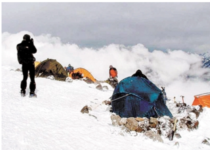
Tábor 4800 m magasságban